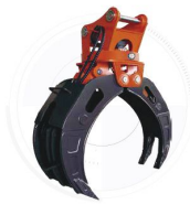
Захват для брёвен

Технические характеристики и конструкция могут быть изменены без предварительного уведомления. На представленные машины может быть установлено дополнительное оборудование.